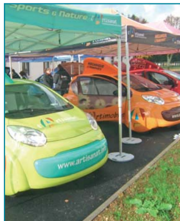
Les Artimobiles, une pédagogie qui fait ses preuves dans les collèges.

public, est l'occasion pour les Chambres de Métiers et de l'Artisanat de Lorraine de traduire ces messages virtuels par des démonstrations et des échanges concrets de tous les artisans de la région.