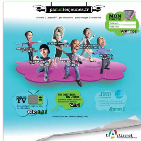
À gauche: Campagne pariclesjeunes.