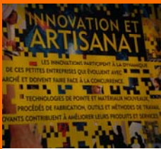
PHOTO EXPOSITION CITE DES SCIENCES