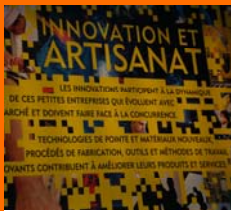
PHOTO EXPOSITION CITE DES SCIENCES