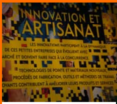
PHOTO EXPOSITION CITE DES SCIENCES