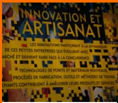
PHOTO EXPOSITION CITE DES SCIENCES